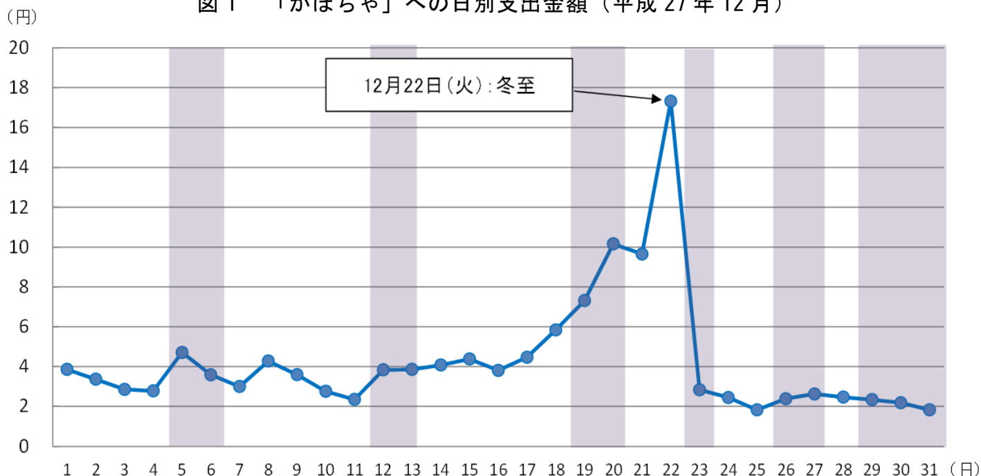
図1 「かぼちゃ」への日別支出金額（平成27年12月）

最初に、昨年（平成27年）12月の1世帯当たりの日別支出金額について見ると、冬至であった22日(火)の支出金額が最も多く、この日を除く当月の1日当たり平均の約4.5倍となっており、冬至に「かぼちゃ」が多く購入されていることが分かります（図1）。