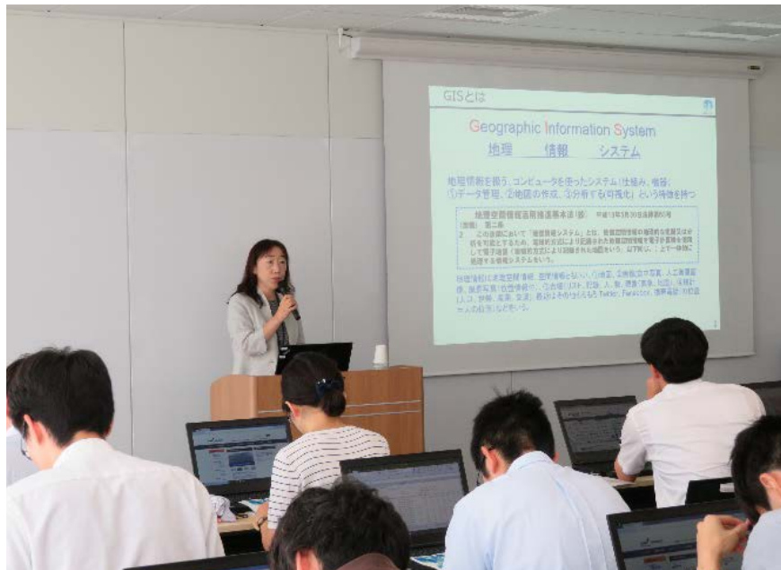
jSTAT MAP の紹介（演習） （（独）統計センター 駒形統括統計職）