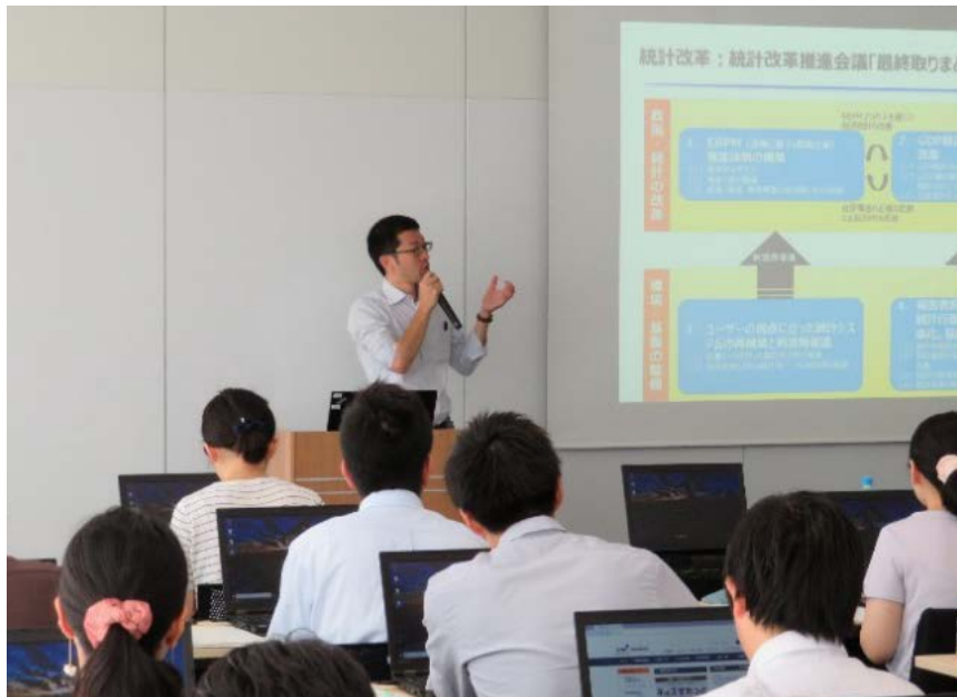
国におけるデータ利活用の現状 (谷道センター長)