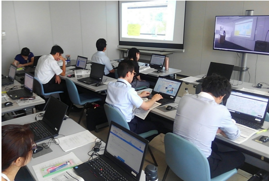
佐賀県サテライト会場（遠隔地へのライブ配信）の様子