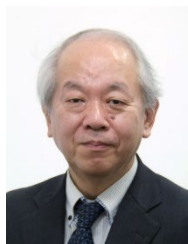
情報・システム研究機構 統計数理研究所長 樺 広計 氏