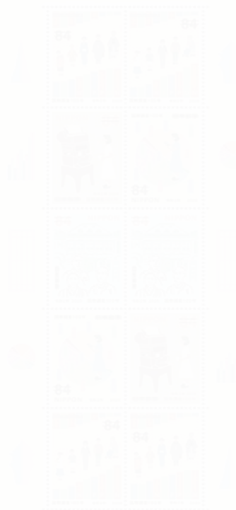
●特殊切手の発行は、大正9年、昭和5年、昭和40年及び平成27年に次いで5回目