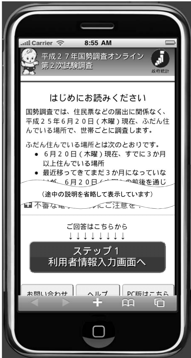
アクセス後の初期画面