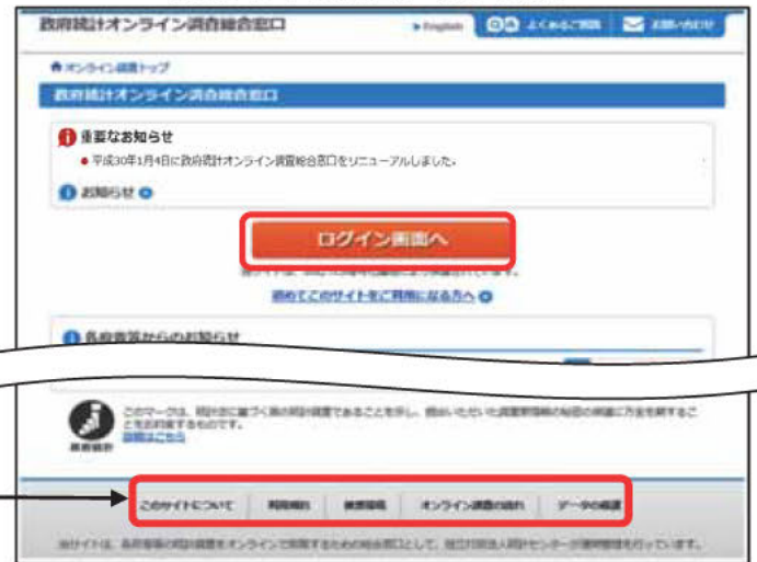
【オンライン調査トップ画面】

「オンライン調査」システムの概要、操作説明、推奨環境や利用規約などを掲載しています。ご利用に当たって、事前にお読みください。