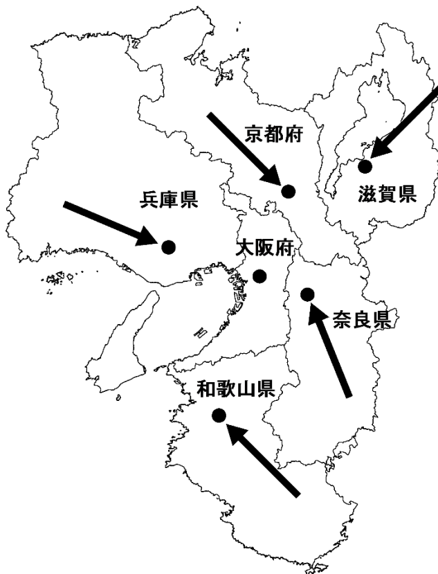
図 2-2 近畿圏の各府県の人口重心の移動方向 (平成22年～27年)