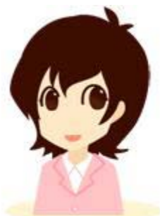
ほんませんせい 本間先生