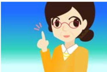
はかり 計 学 園 長