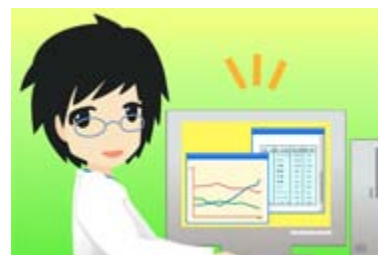
どうしたせんせい 堂下先生

とうけいきょく じゅうたく とちとうけいちょうさ 統計局の住宅・土地統計調査の ホームページにこたえがありそうだよ！