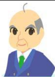
とどうきょうとう 統堂教頭

とうけいきょく じゅうたく とちとうけいちょうさ 統計局の住宅・土地統計調査の ホームページにこたえがありそうだよ！