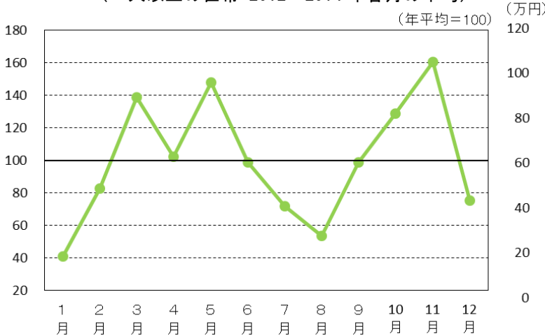
図1 月別1世帯当たり1か月の挙式・披露宴費用への支出 (二人以上の世帯 2012~2014年各月の平均)