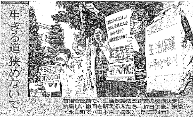
首相官邸前で、生活保護法改正案の閣議決定に抗議し、撤回を訴える人々。一七日夜、東京・永田町で。【記事24面】

原則としてOB企業と随意契約をしないよう方針を変更。「赤字の垂れ流し」と批判された原子力のPR施設の運用も見直した。 その一方、機構は福島第一原発の事故で、除染や事故収束に向けた技術開発など業務を拡大している面もある。国の原子力予算の約四割にあたる千六百六十七億円(本年度)を機構が握っている。