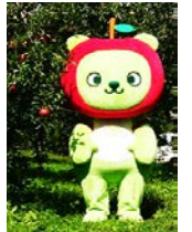
長野県観光PRキャラクター「アルクマ」