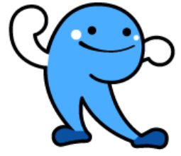
高知県イメージキャラクター 「くろしおくん」