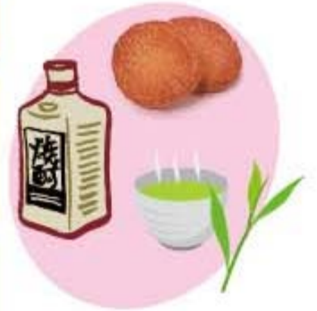
資料/家計調査(鹿児島市)