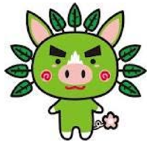
かごしまPRキャラクター「ぐりぶー」

黒牛黒豚の飼養数全国1位の鹿児島県。県内各地でその味を堪能できます。また他にも、黒さつま鶏、さつまあげ、焼酎なども人気が高く、ヘルシーなグルメも多彩です。鹿児島の“食”の味を是非お楽しみください。