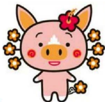
かごしまPRキャラクター「さくら」

南北600キロに及ぶ広大な県土を有する鹿児島県には、世界自然遺産に登録されている屋久島、鹿児島市街地から間近に臨む活火山「桜島」など、多様で豊かな自然に恵まれています。人を元気にする魅力的な「本物の素材」があふれている鹿児島県。本物だけが持つパワーを観て、知って、感じてください。